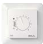
DEVIREG™ 530, 531, 532 süllyesztett