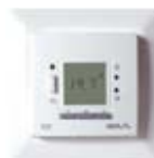
DEVIREG™ 535 programórával