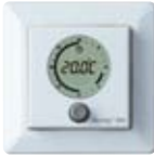
DEVIREG™ 550 intelligens időzítővel

DEVI Link™ rendszer: a DEVI Link™ az elektromos fűtésrendszer és egyéb berendezések rádiófrekvenciás összeköttetésére, és egy központi helyről történő vezérlésére szolgál. Az érintőképernyős központ kezelése rendkívül egyszerű.