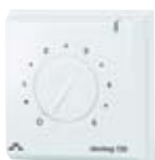
DEVIREG™ 130, 132 falon kívüli